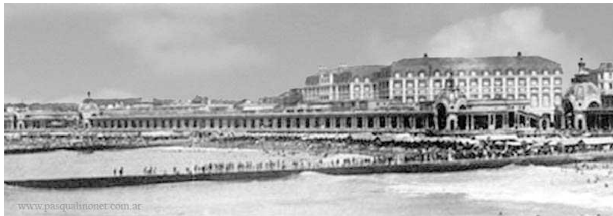
Mar del Plata en sus inicios.

reemplazada por las nuevas familias marplatenses. Mar del Plata ya se consolidaba como el principal destino turístico de la Argentina y uno de los balnearios más importantes del mundo.